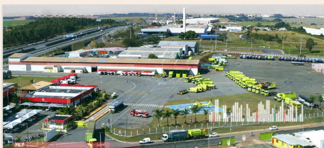
Campo de treinamento da Ambipar em Nova Odessa