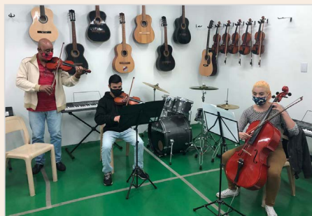
ONG Seci: de volta às atividades seguindo protocolos

As aulas de futebol, canto e instrumentos musicais, inglês e reforço escolar foram retomadas seguindo os protocolos